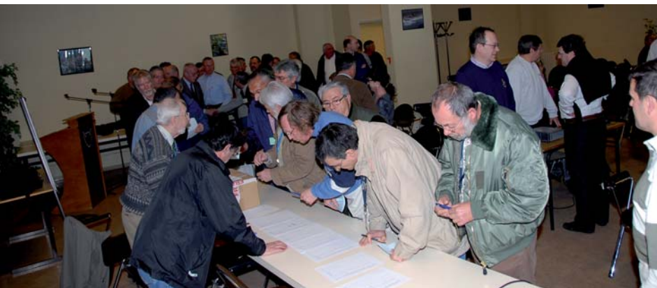
Pendant le vote

Pour les résultats du nouveau Conseil d'administration voir l'encadrer ci-contre.