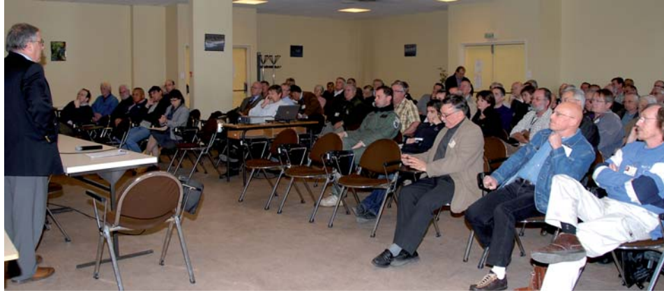
Les adhérents pendant l'assemblée

Collection vol, nous possédons actuellement un seul avion capable de voler : le Stampe. Un projet d'échéance à long terme, la remise en état du Guépard.